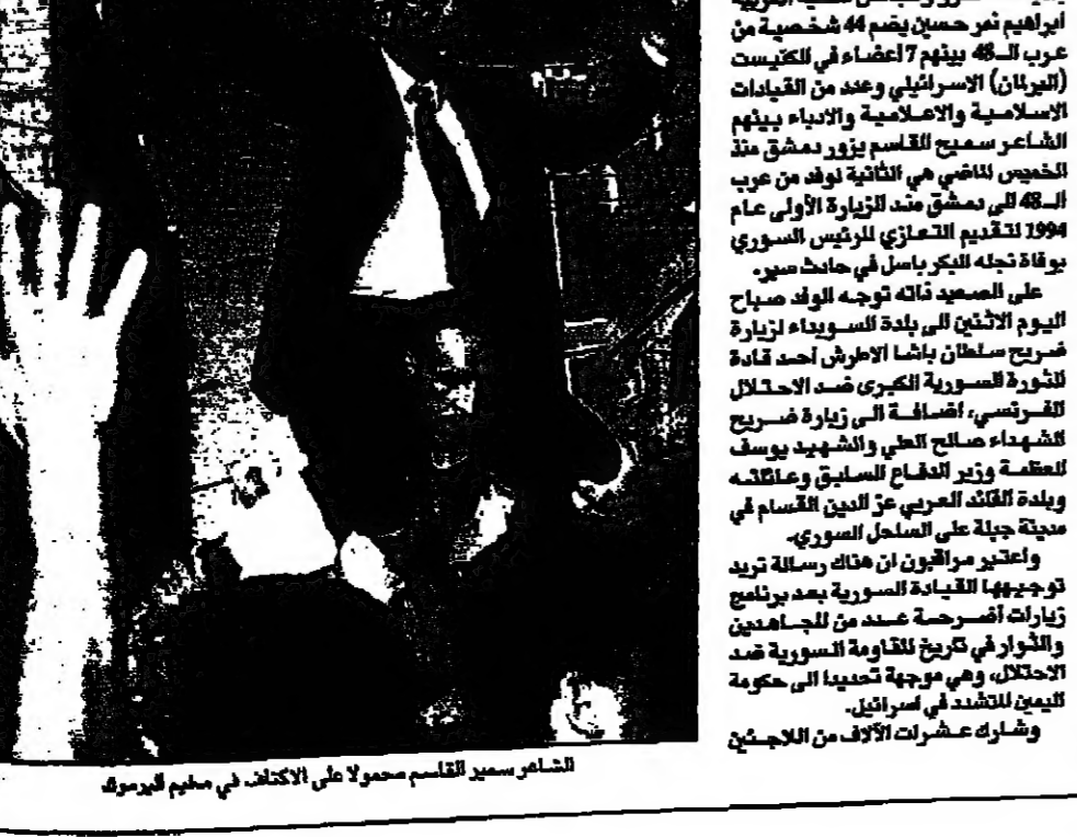
التمساح سمير القاسم محمولا على الكراسي في مخيم اليرموك

وقال سفير سورية في دمشق محمد جواد كحلان في كلمة له خلال الاحتفال: "نحن سعداء بقدومكم إلى مخيم اليرموك، ونحن نأمل أن تكون هذه الزيارة بداية لتعاون جديد بيننا وبينكم".